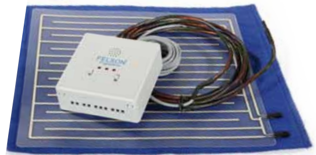
Optimér mulighederne med tilbehør.